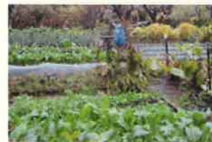
生ごみの堆肥を実践する畑