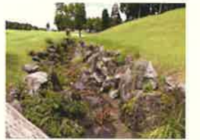
大淵の沢（イメージ）