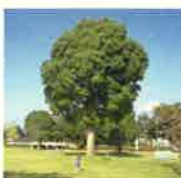
クスノキ （シンボルツリ）