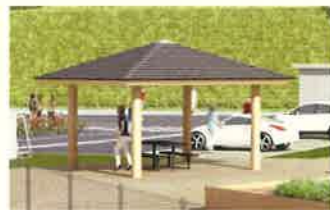
富士檜を活用したあずまや