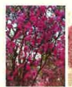
ミツバツツジ・ベニカナメモチ・キンメツゲ （低木）