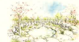
モリアオガエルの池（イメージ）

事業地内には工事着工前の調査でモリアオガエルの生息が確認されています。モリアオガエルの産卵に適した水場を計画します。