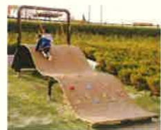
廃材や廃プラスチックを再利用した遊具（例）